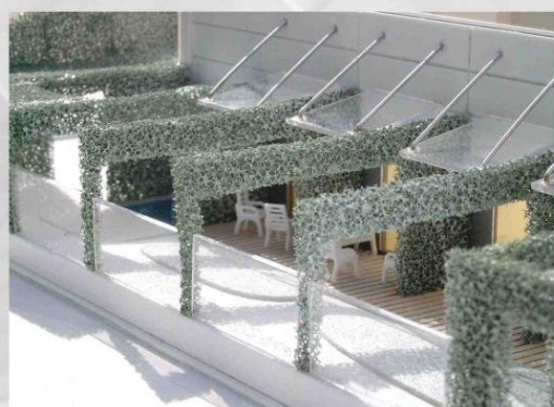
TERRASSEN VOR DEN PATIENTENZIMMERN